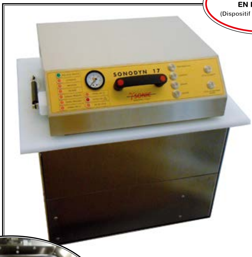
SONODYN 17- E (Modèle Encastrable)

Laveur-Désinfecteur EN ISO 15883-1 (Dispositif Médical Classe IIb)