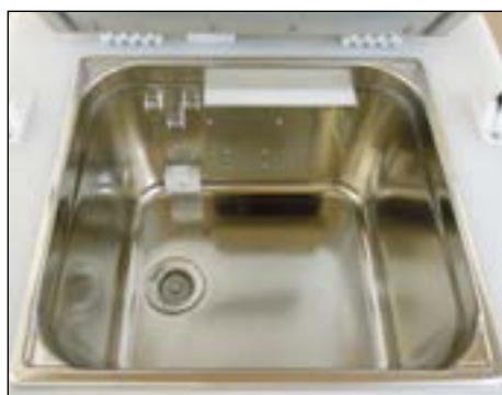
SONODYN 17-E Contenance : 1 panier P12 ou 2 paniers P3