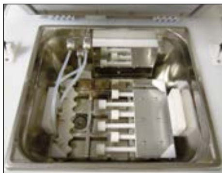
SONODYN 17-E avec panier P.I.R. (Porte-Instruments Rotatifs)

EN FIN DE MISE EN SERVICE, LAISSER L'APPAREIL EN ÉTAT DE PROPRETÉ (cuve rincée et essuyée - capot propre)